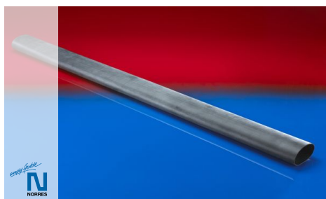
Tubo del ventilatore del diaframma