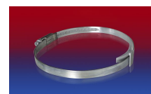
CLAMP 210 BRIDGE CLAMP

Nad i podciśnienie są zalecanymi eksploatacyjnymi wartościami granicznymi, na specjalne zamówienie produkty mogą być poddawane wyższemu obciążeniu. Promień gięcia mierzony na wewnętrznej stronie gięcia węża. Zastrzega się prawo do dokonywania zmian technicznych. Wszystkie wartości pomierzono w temperaturze 20 °C i są one wartościami przybliżonymi. Dalsze dane techniczne są dostępne na stronie www.norres.com/pl/technika/ .