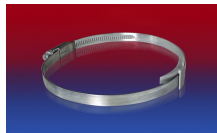
CLAMP 210 BRIDGE CLAMP