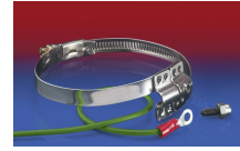
CLAMP 212 EC