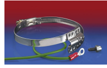
CLAMP 212 EC