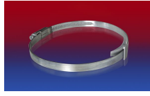
CLAMP 210 BRIDGE CLAMP