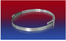
CLAMP 210 BRIDGE CLAMP