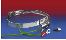
CLAMP 212 EC