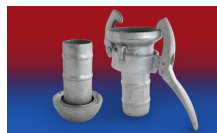
CONNECT KARDAN 254