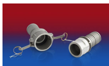
CONNECT KAMLOK ALU CLAMP 211 253