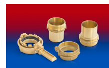
CONNECT TANK TRUCK BRASS 252