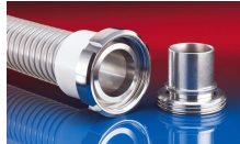
CONNECT MOULD ASSEMBLY 233