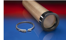
CONNECT 245 VAC- TRUCK