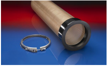
CONNECT 245 VAC-TRUCK