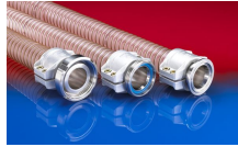
CONNECT SAFETY CLAMP ASSEMBLY 231