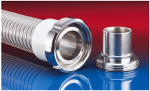
CONNECT MOULD ASSEMBLY 233