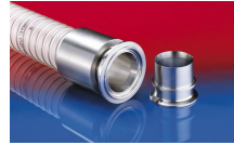
CONNECT PRESS ASSEMBLY 232