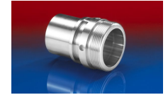
CONNECT THREAD FITTING 234