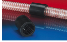
CONNECT 246 AS