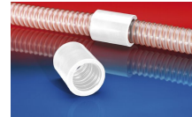
CONNECT 246 FOOD