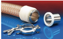
CONNECT TRI-CLAMP FITTING 245