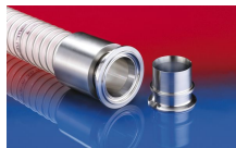
CONNECT PRESS ASSEMBLY 232