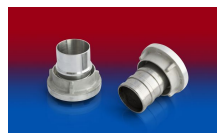
CONNECT STORZ DIN ALU 251