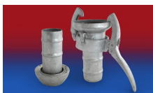
CONNECT KARDAN 254