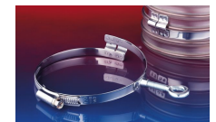
CONNECT 245 FOOD