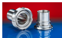
CONNECT ASEPTIC FITTING 249