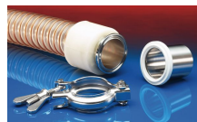
CONNECT TRI-CLAMP FITTING 245