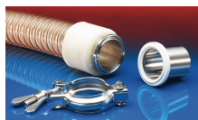
CONNECT TRI- CLAMP FITTING 245