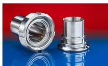
CONNECT ASEPTIC FITTING 249