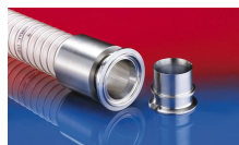
CONNECT PRESS ASSEMBLY 232