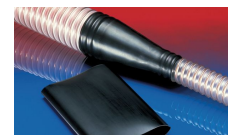
CONNECT 240 + 241 FOOD