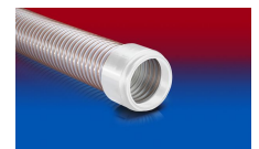
CONNECT 245 FOOD

Les pressions et dépressions sont des valeurs recommandées en seuil de fonctionnement; les produits peuvent être soumis à des valeurs plus élevées sur demande. Le rayon de courbure est mesuré à partir de l'axe de la gaine. Tout droit d'apporter des modifications techniques est réservé. Toutes les valeurs déterminées sont données à une température de 20°C environ. Données techniques complémentaires sur: www.norres.com/fr/technologie/ .