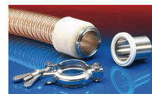
CONNECT TRI- CLAMP FITTING 245