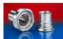
CONNECT ASEPTIC FITTING 249