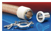
CONNECT TRI- CLAMP FITTING 245 FOOD