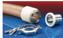
CONNECT TRI-CLAMP FITTING 245