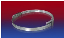
CLAMP 210 BRIDGE CLAMP