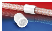
CONNECT 246 FOOD