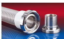
CONNECT MOULD ASSEMBLY 233