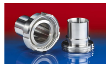
CONNECT DAIRY FITTING 247