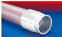
CONNECT 243 FOOD