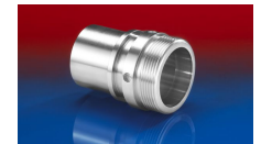
CONNECT THREAD FITTING 234