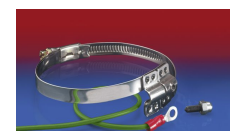
CLAMP 212 EC

Les pressions et dépressions sont des valeurs recommandées en seuil de fonctionnement; les produits peuvent être soumis à des valeurs plus élevées sur demande. Le rayon de courbure est mesuré à partir de l'axe de la gaine. Tout droit d'apporter des modifications techniques est réservé. Toutes les valeurs déterminées sont données à une température de 20°C environ. Données techniques complémentaires sur: www.norres.com/fr/technologie/ .