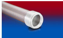
CONNECT 245 FOOD