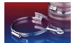
CONNECT 240 + 241 CLAMP 217 FOOD