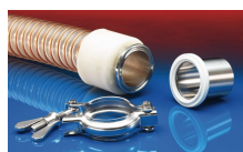
CONNECT TRI- CLAMP FITTING 245