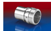
CONNECT THREAD FITTING 234