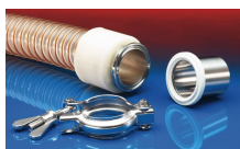
CONNECT TRI-CLAMP FITTING 245