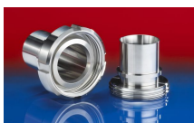
CONNECT DAIRY FITTING 247