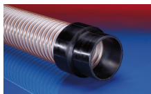
CONNECT 240 EC