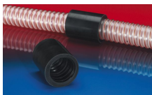
CONNECT 246 AS