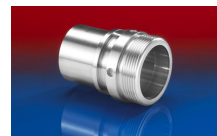
CONNECT THREAD FITTING 234