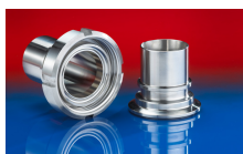
CONNECT ASEPTIC FITTING 249