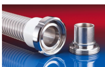
CONNECT MOULD ASSEMBLY 233