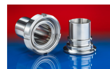
CONNECT ASEPTIC FITTING 249

La sovrappressione e la sottopressione sono valori limite di funzionamento raccomandati, i prodotti possono essere sottoposti a carichi maggiori su richiesta. Il raggio di curvatura è misurato attraverso l'interno dell'arco del tubo. Ci riserviamo il diritto di apportare modifiche tecniche. Tutti i valori sono determinati a 20°C e sono dati approssimativi. Ulteriori informazioni su norres.com/it/tecnologia/ .