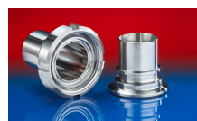
CONNECT ASEPTIC FITTING 249