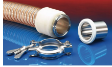
CONNECT TRI-CLAMP FITTING 245