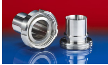
CONNECT DAIRY FITTING 247