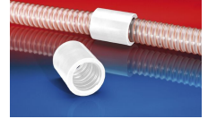
CONNECT 246 FOOD