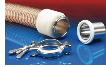
CONNECT TRI- CLAMP FITTING 245