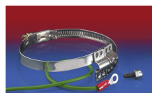
CLAMP 212 EC