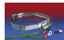
CLAMP 212 EC