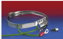
CLAMP 212 EC