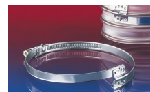
CLAMP 212 CLAMP