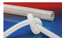
NORPLAST® PUR 385 AS (LD)