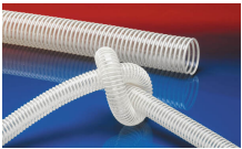
NORPLAST® PUR 385 AS (LD)