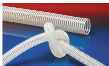
NORPLAST® PUR 385 AS (LD)